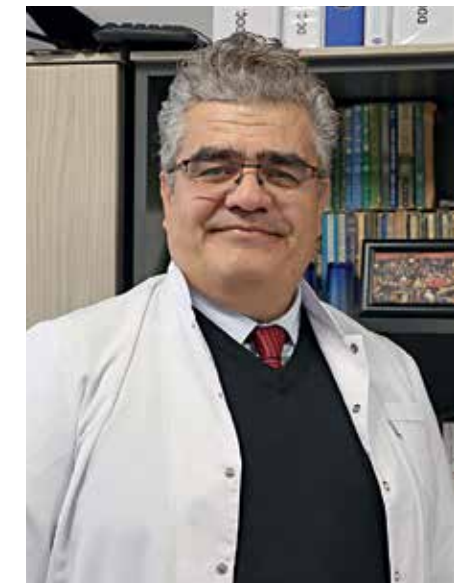
sigara olan bir anne - babanın evladına "Bunu içme!" demesi ne kadar

Ebeveynlere çocuklara rol model olmaları anlamında çok büyük roller düştüğünü anlatan Yalçın, "Elinde